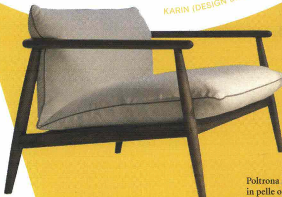
Poltrona in frassino con cuscini in pelle o tessuto.

KARIN (DESIGN SETSU & SHINOBU ITO) DESIRÉE - 2018