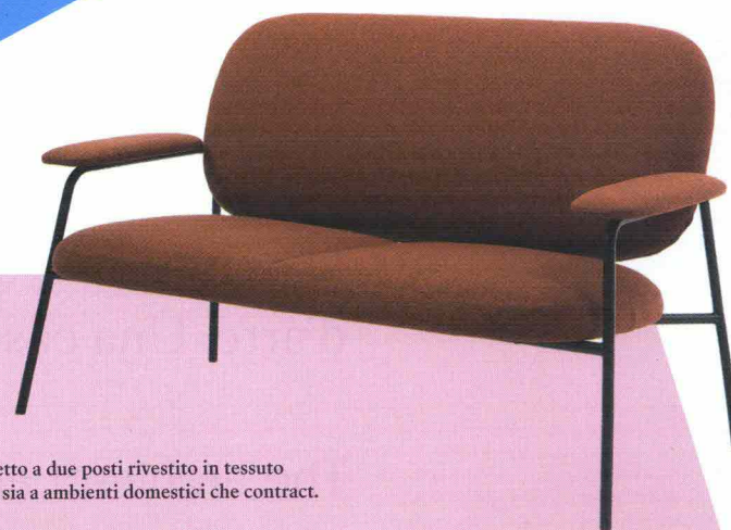
Divanetto a due posti rivestito in tessuto adatto sia a ambienti domestici che contract.

ZERO (DESIGN ANDREA BONINI) TURRI - 2019