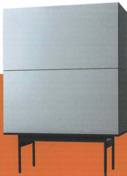
Madia modulare con ante in legno laccato. Modular cupboard with lacquered wood doors.

BRICK (DESIGN SIMONE CAGNAZZO) CACCARO - 2017