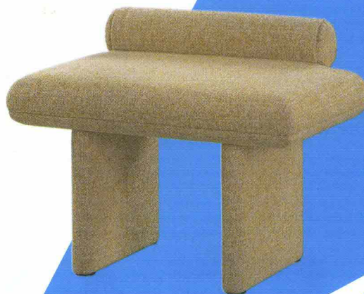
Pouf imbottito e rivestito in tessuto ispirato alle geometrie orientali.

BRICK (DESIGN SIMONE CAGNAZZO) CACCARO - 2017